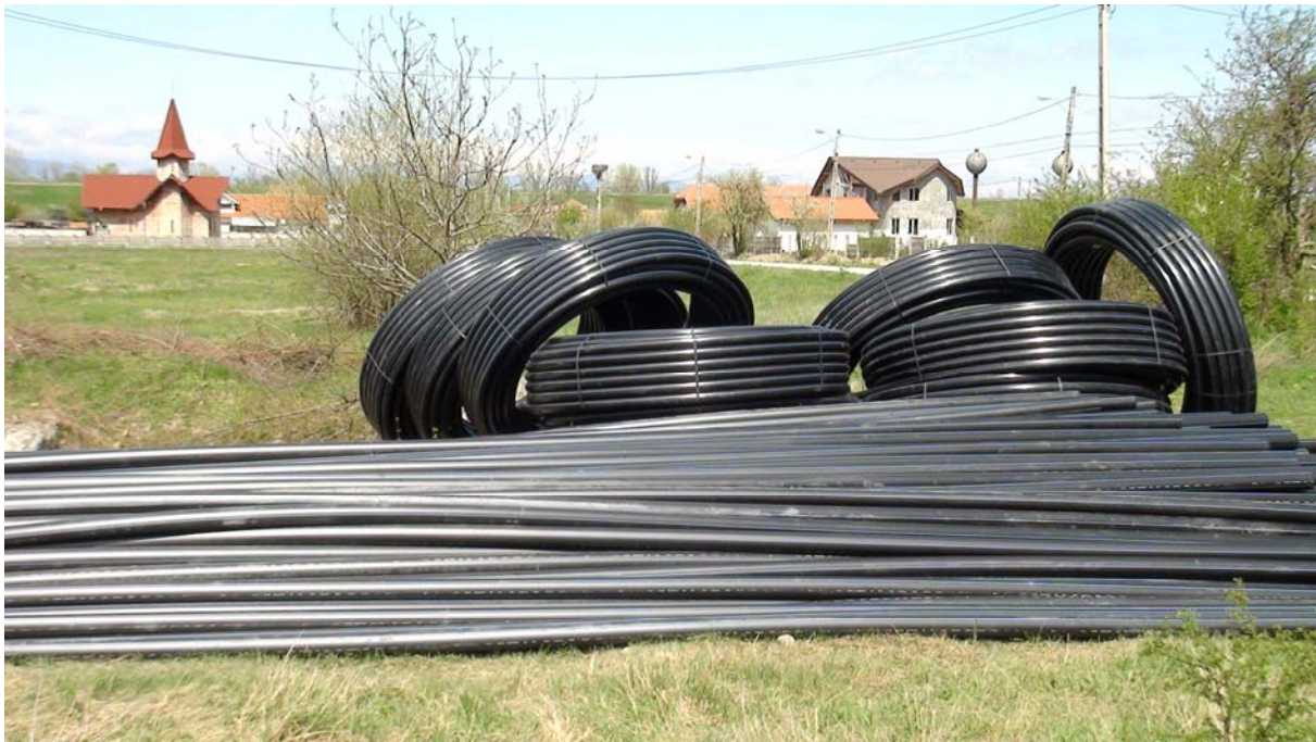
Alimentare cu apă Cartierul Vîrț