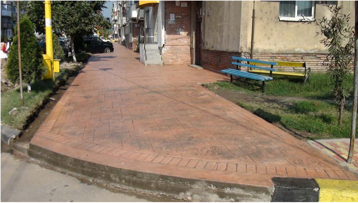
Reabilitarea trotuare Strada Tineretului (beton amprentat)