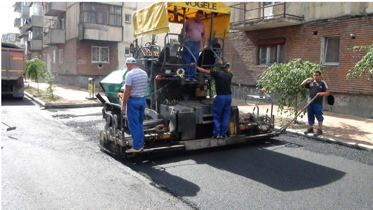
Reabilitare străzi/alei (Strada Castanilor, Strada Florilor, Aleea Zorilor, Aleea Zambilelor)