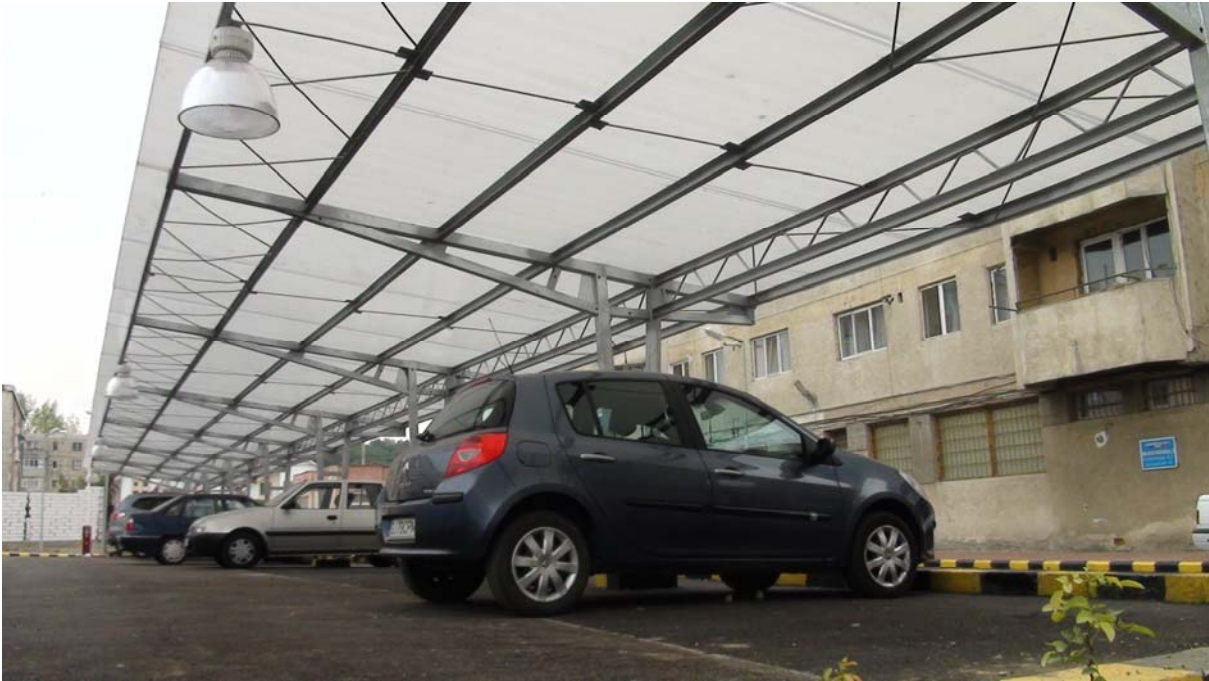
Amenajare parcări de reședință