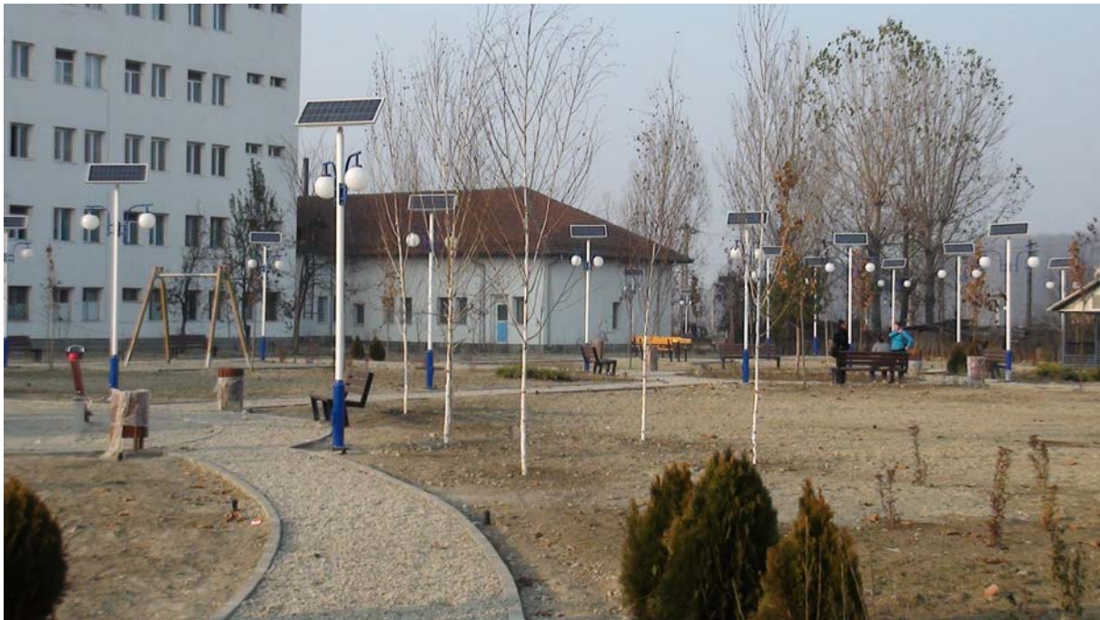
Construire parc ecologic