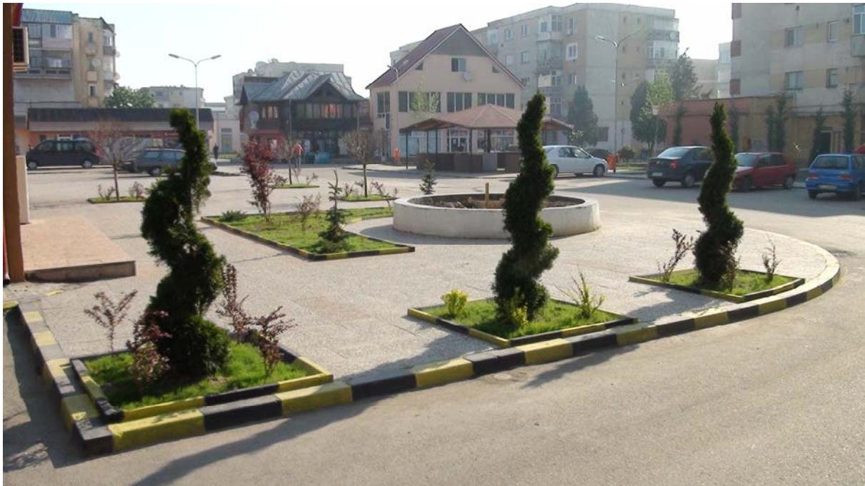
Amenajare Ambiental Piața Veche