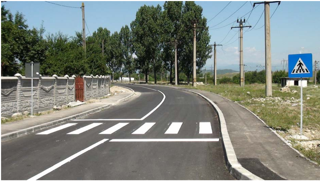
Reabilitare șoseaua de centură