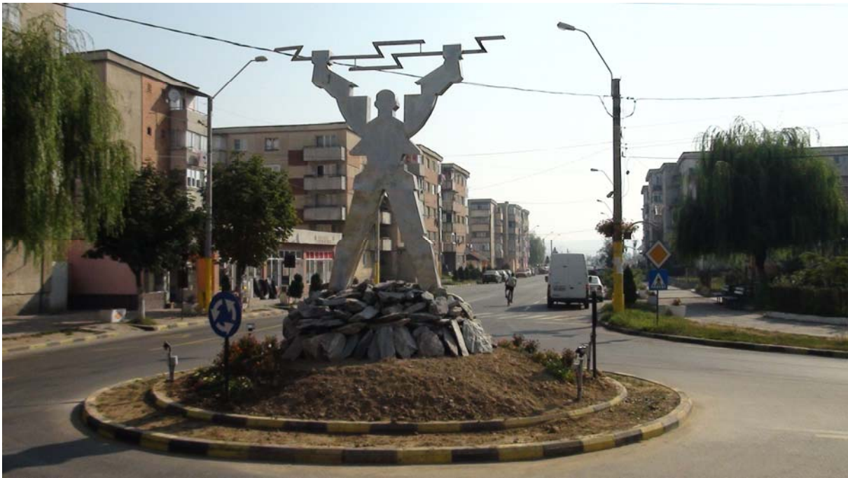
Amenajare Sens Giratoriu Strada Termocentralei