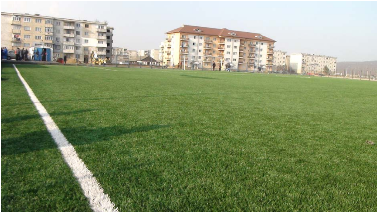
Teren sintetic Stadionul Tineretului