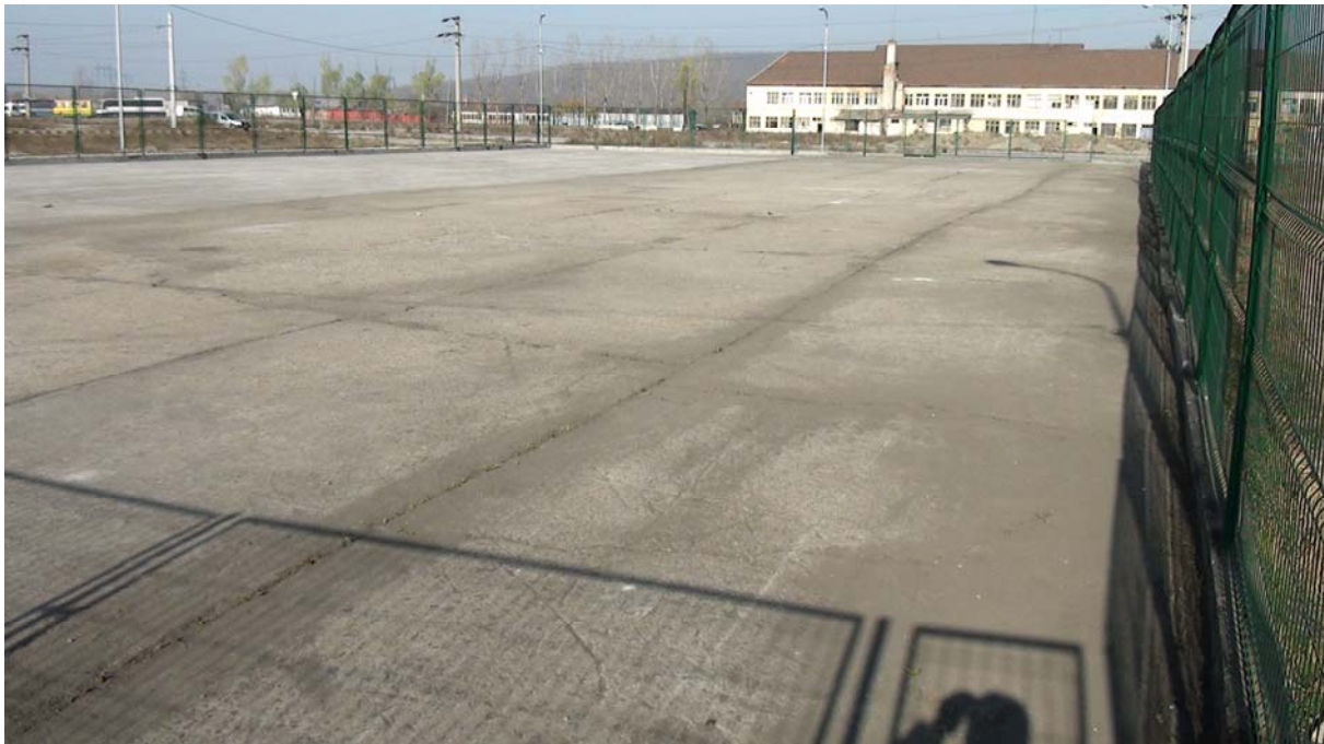
Construcție parcare de mare tonaj