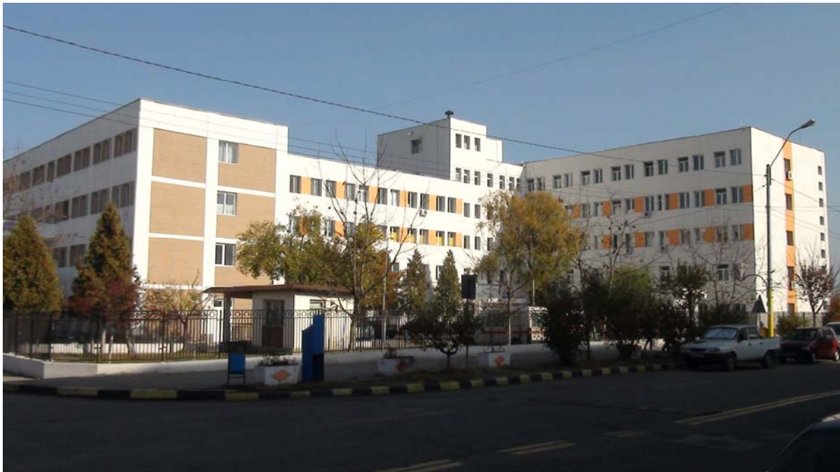
Anvelopare clădire Spitalul „Sf. Ștefan” Rovinari