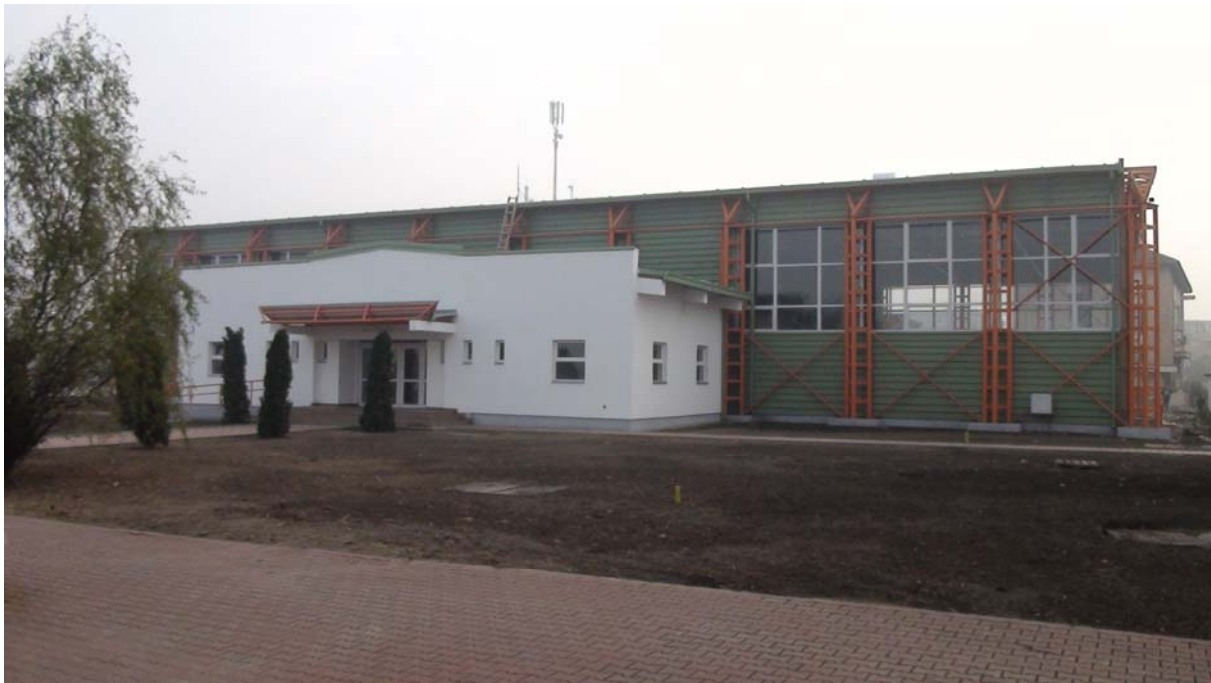
Sală de Sport Bulevardul Minerilor