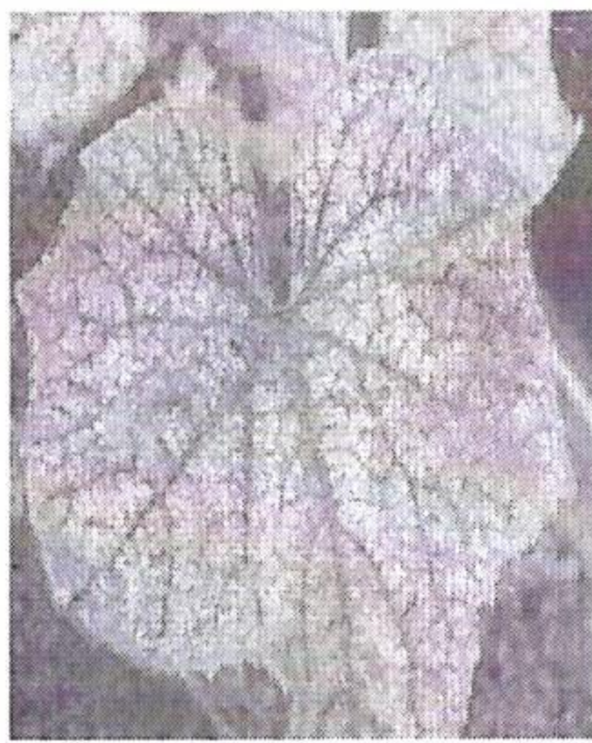
Păianjenul rosu comun