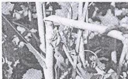
putregaiul alb al tulpinilor la rapita

Boli : putregaiul alb ( Botrytis cinerea ), putregaiul negru ( Phoma l. ), alternarioza ( Alternaria b. ) Daunatori: puricii ( Phyllotreta a. și Phyllotreta nemorum ), gargarita tulpinilor de rapita ( Ceuthorynchus napi )