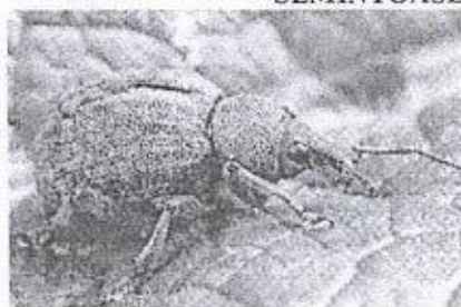
Gargarita florilor de mar