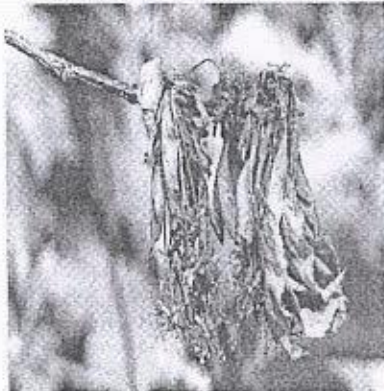
Monilioza flori și ramuri