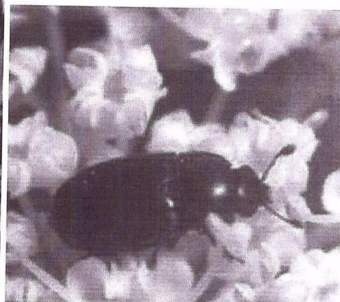
gandacul lucios al rapitei

Boli : putregaiul alb ( Botrytis cinerea ),putregaiul negru ( Phoma l. ), alternarioza ( Alternaria b. )