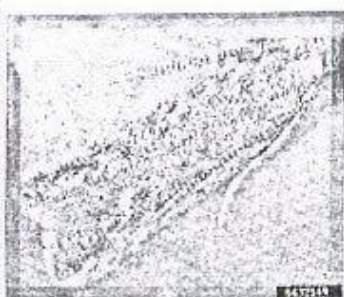
Molia miniera a frunzelor de tomate(Tuta absoluta)