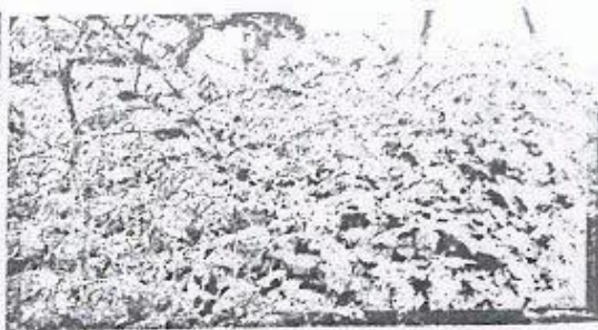
Atac pe tomate a moliei miniere a frunzelor de tomate

Atentie! Musculita alba de sera s-a raspandit și în culturile din câmp deschis.